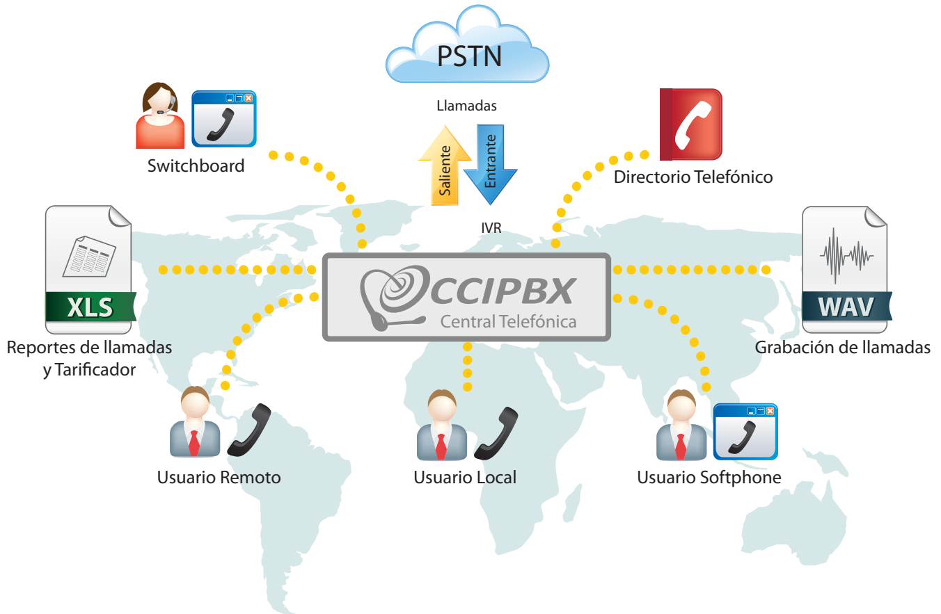
Diagrama de aplicación